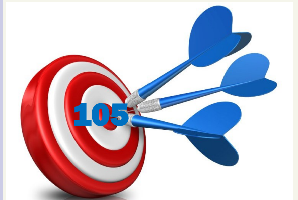
■ Total des Inclusions

Afin de compenser la perte de quelques patients qui n'ont pas pu atteindre le critère primaire de jugement sous traitement, un amendement pour augmenter l'effectif global à 105 patients sera revu par le CPP le 14 septembre. Nous vous tiendrons au courant très rapidement mais restons mobilisés, CE N'EST PAS FINI!